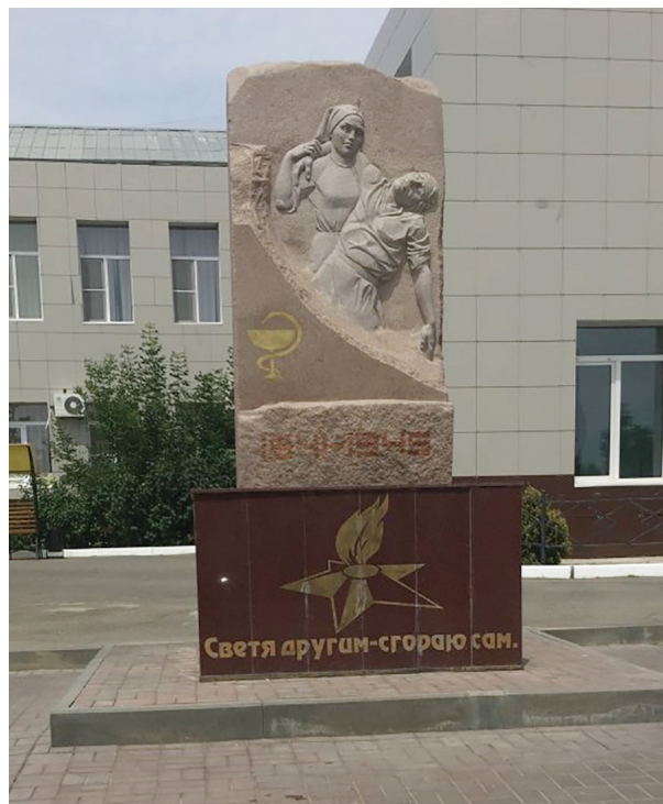
Рис. 5. Памятник медикам, погибшим в годы ВОВ. Открыт 29 апреля 2015 года. Автор казахский скульптор Едиге Рахмадиев