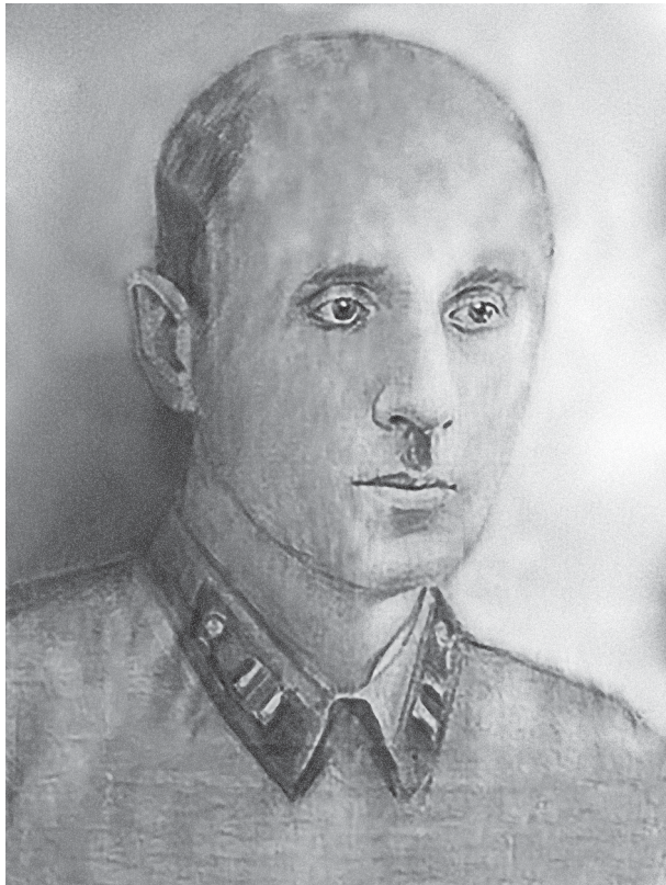
Рис. 2. М. Протасов «Портрет хирурга Николая Лычманова». Ткань, сухая кисть. 1943 год

ей в Великой Отечественной войне 1941–1945 гг.».