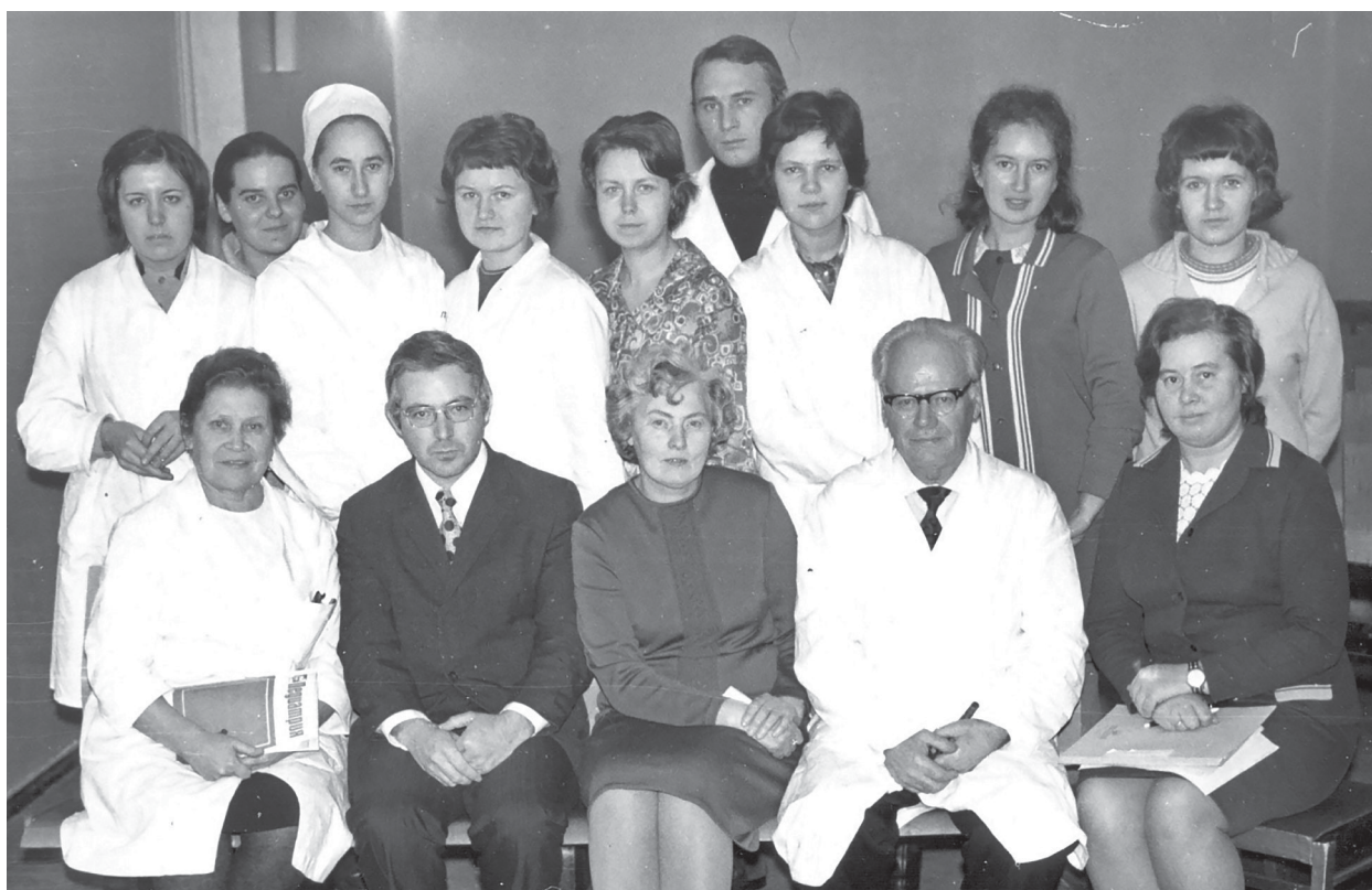
Рис. 3. Заседание СНО на кафедре социальной Гигиены и организации здравоохранения ЛПМИ. 1976 г.