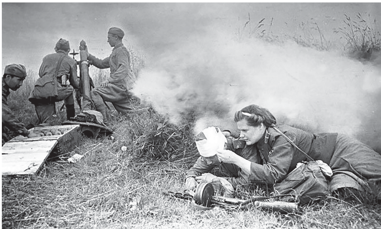
Рис. 4. Отважная девушка-санитарка, оказывающая первую медицинскую помощь на поле боя