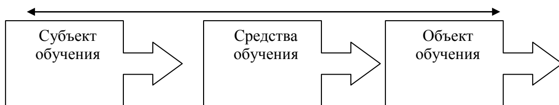
Рис. 1 Структура дистанционного обучения

Структура дистанционного обучения представлена на рисунке 1: